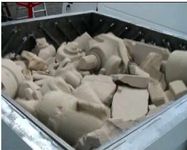
Abb.1: Blick in den Raspeltopf mit Kernbruch

Die Zuführung des Kernbruches in den Raspeltopfes erfolgt durch ein Förderband oder direktes Entleeren von Sammelbehältern in den Aufgabetrog. Durch zwei an den Seiten befindlichen Unwuchtmotoren wird der Aufgabetrog in Schwingungen versetzt. Die Oberflächenstruktur der Trogwand bzw. das Aneinanderreiben der Kernbruchstücke zerkleinert das Aufgabematerial.