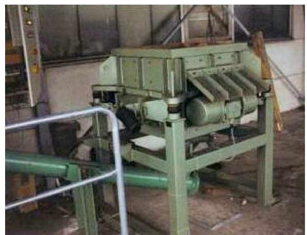
Abb.2: Raspeltopf RT 700 der Kernbruchaufbereitungsanlage in einer Gießerei