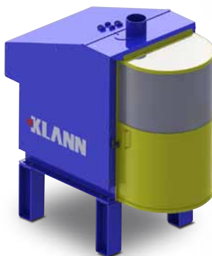
КМ смеситель с фронтальной защитой для отдельной установки