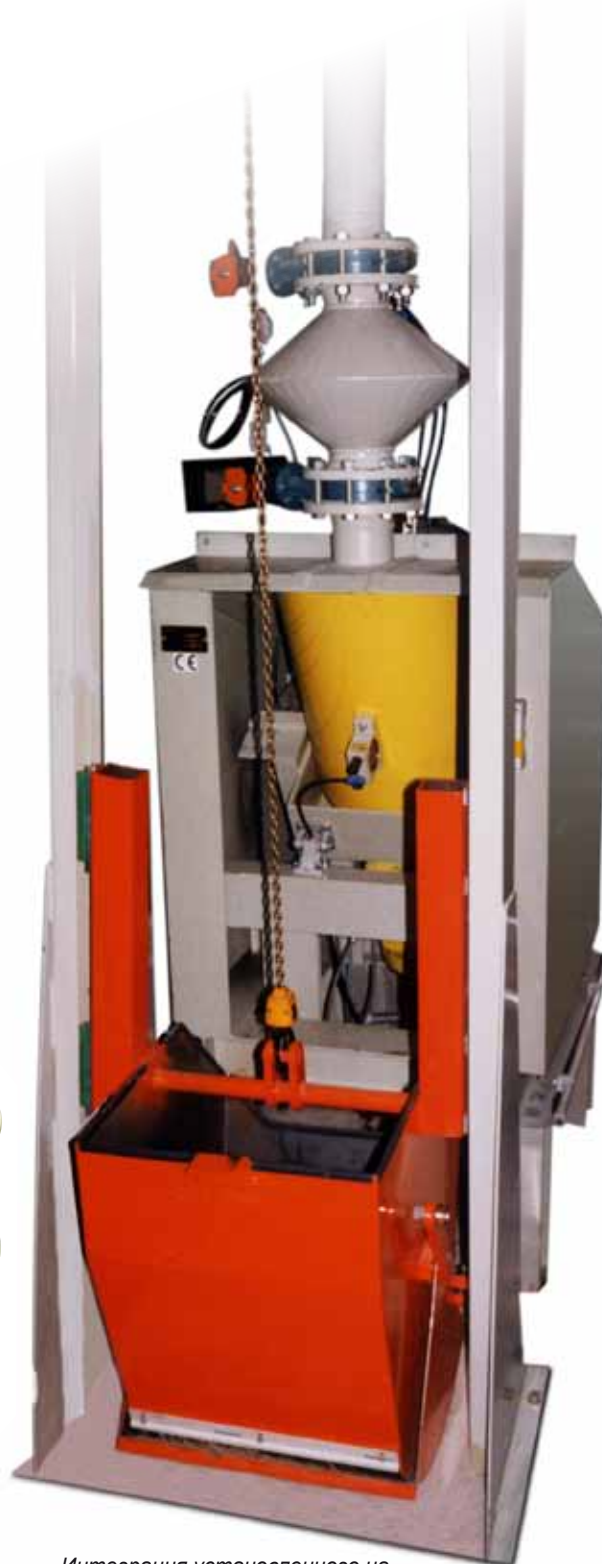
Интеграция установленного на уровне пола смесителя КМ с системой транспортировки емкостей HLK