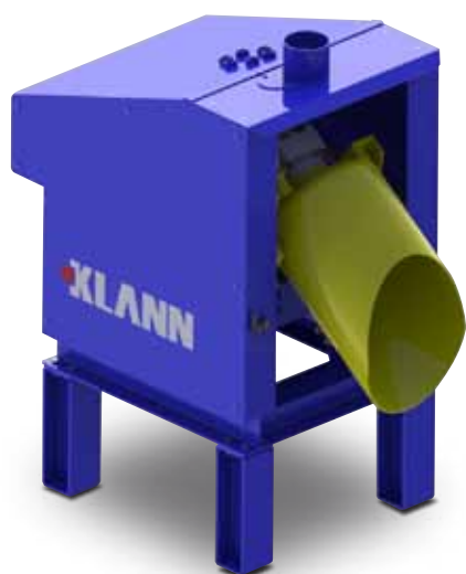
КМ смеситель в положении выгрузки

Подача песка может производиться, в зависимости от условий, с помощью волюмометрической или весовой дозировки. Волюмометрическая дозировка позволяет производить загрузку предусмотренных полных или половинных доз. Использование весовой емкости делает возможным переменную загрузку разных видов сырья и примесей с заявленной точностью. Данная дозирующая установка предлагается KLANN как составная часть системы смешивания стержневой смеси.