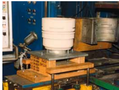
Выдача стержней на выступающую часть станочного стола