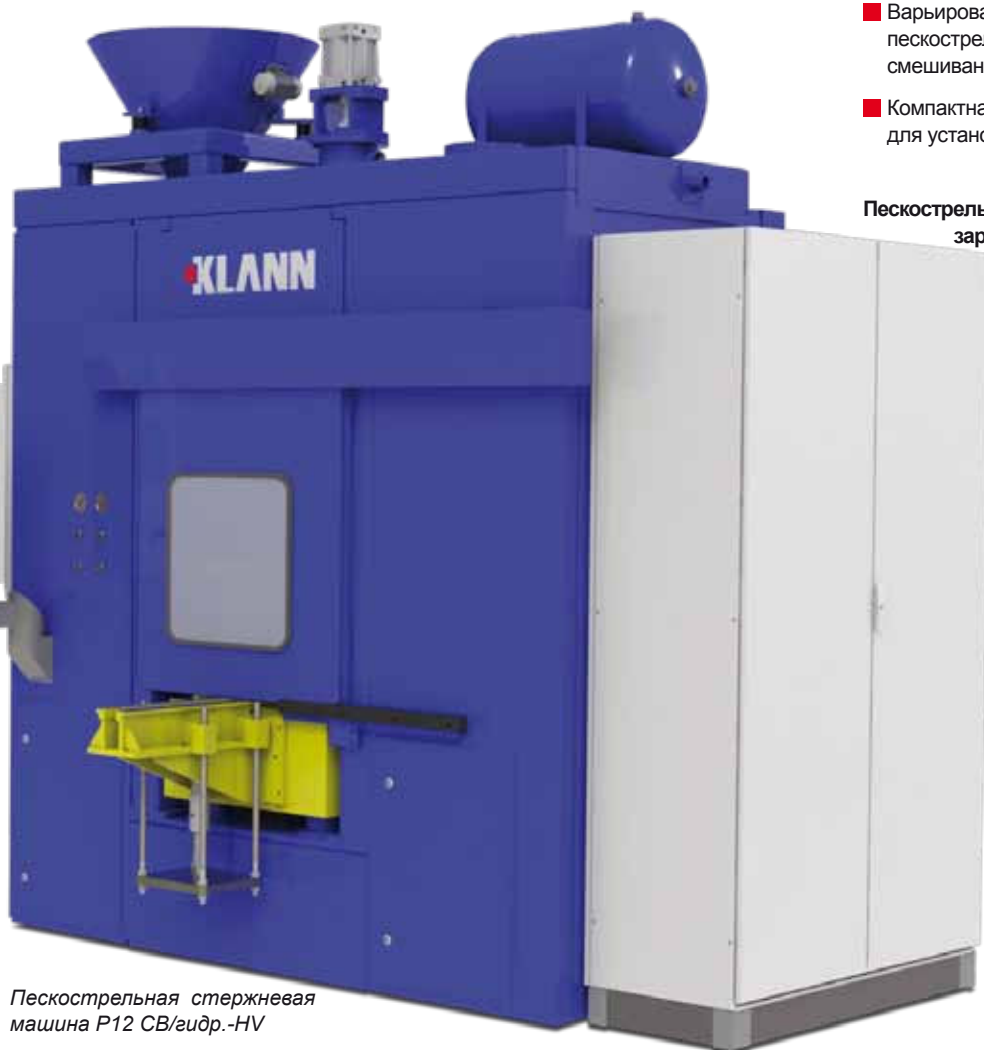
Пескострельная стержневая машина P12 СВ/гидр.-HV

Пескострельные стержневые машины KLANN зарекомендовали себя на практике в многолетнем использовании и рассчитаны для полностью автоматического режима работы в 3 смены. В наличие имеются машины для горизонтального и/или вертикального расположения стержневых ящиков. Наряду с чисто Hot-Box, Cold-Box или CO 2 -автоматами могут поставляться комбинированные машины, которые наряду с термической печью имеют устройство насыщения металла газами.