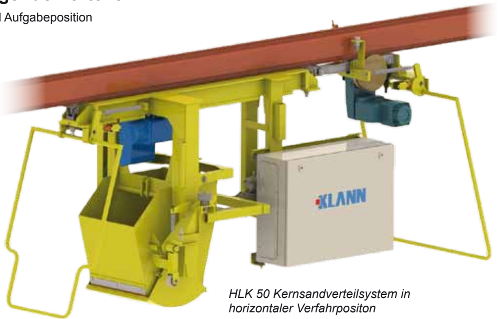
HLK 50 Kernsandverteilsystem in horizontaler Verfahrposition

Das System bietet sich auch bei vorhandenen Kernmachereien zur Nachrüstung an.