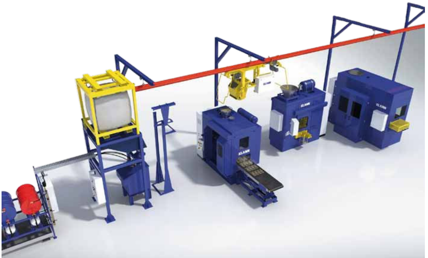
Mögliche Anlagenkonfiguration mit Kernsandung und -verteilung